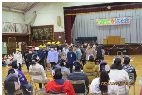
5年生 「新しい6年リーダーズ」