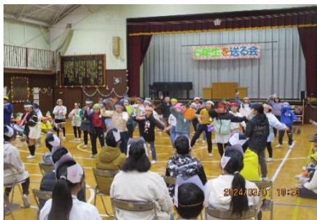
4年生 「熱狂!! OYA 37」