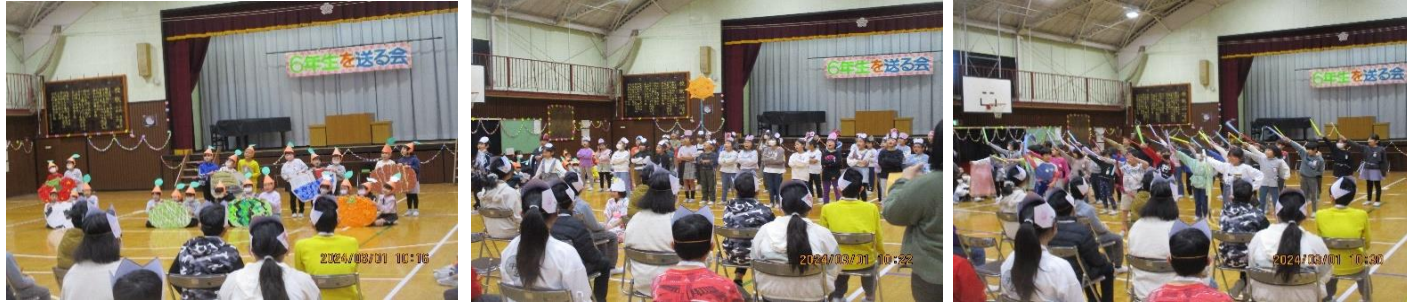
1年生 「オレンジピクミンの大ぼうけん」