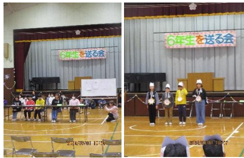
6年生 「おやえもんニュース」

お知らせとお願い 1 下記ボランティアにご協力いただける方は教頭までご連絡ください。※3月通知参照 (1) 登下校見守り隊・朝 7:30～7:50 ・夕方 14:30～15:00 15:30～16:00 ・時間や場所は問いません。 (2) 豊作・畑応援団・毎週月曜日の午前中、畑での作物栽培。経験を問いません。 2 大家小西門工事に関して (1) 2/27のマメールの通り、西門工事が3/29(金)まで延期となりました。子供達には、春休み中、学校を訪れた際の注意喚起をしました。地域、保護者の皆様もご注意ください。