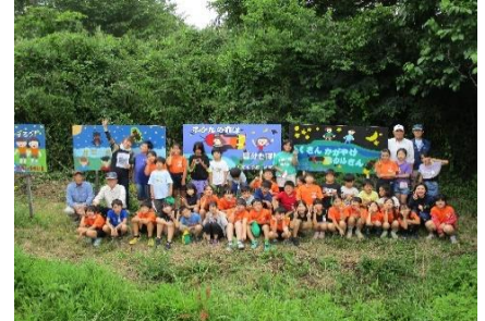
4年生 ほたるの看板設置