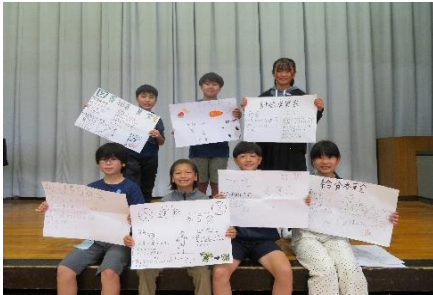
児童集会：委員長紹介