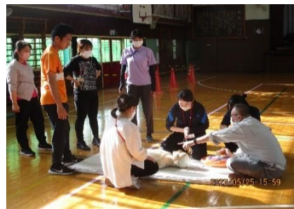
命を守る心肺蘇生法講習会